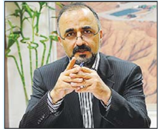
مدیر عامل شرکت ملی حفاری ایران خبر داد:

آغاز همکاری های دو جانبه ایران و عراق در بخش حفاری