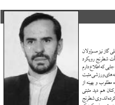
رئیس هیات طنابچوب شرکت ملی گاز: