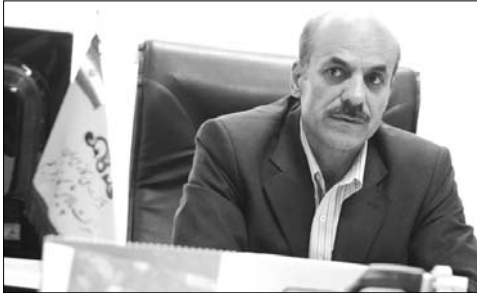
تأثیر مثبت این حضور در منطقه گفت: وقتی مسابقات لیگ در جهم برگزار می شود ما شاگردان زیادی پیروزه یان بین جوانان مسابقات را از تریک می شناسیم می کنند و حضور این افراد در ورزشگاهها باعث افزایش شور و نشاط در منطقه شده که حاصل تلاش شرکت پالایش گاز فجر جم بوده که در مجموع به نفع کل اهالی منطقه است.

مدیرعامل باشگاه فرهنگی ورزشی گاز فجر جم: حضور پررنگی در عرصه ورزش قهرمانی داریم