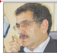
چالش خاک جمع های پتروشیمی در گوناگون پتروشیمی، فرصتی طلایی برای برتری ایران در صنعت پتروشیمی