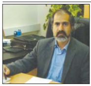
مدیرعامل ره آوران فنون پتروشیمی، آموزش تخصصی، کلید توسعه و رونق صنعت پتروشیمی است