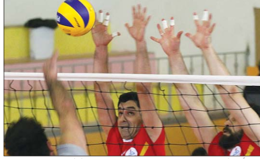
محمود آباد دنبال شد.

۱-بالای و ۱-نفت، ۲-نفت الف، ۳-بالای و پخش نفت الف، ۴-پتروشیمی، ۵-بالای و پخش، ۶-فونسال، ۱-بالای و پخش الف، ۲-نفت ب، ۳-گاز تنیس روی میز، ۱-پتروشیمی، ۲-نفت الف، ۳-نفت ب، ۴-شرطنج، ۱-پتروشیمی، ۲-بالای و پخش الف، ۳-نفت الف، ۴-تنیس زمینی، ۱-بالای و پخش، ۲-نفت ب، ۳-پتروشیمی، ۴-کشتی آزاد، ۱-بالای و پخش الف، ۲-پتروشیمی، ۳-نفت ب، ۴-کشتی فرنگی، ۱-بالای و پخش الف، ۲-پتروشیمی، ۳-بالای و پخش ب، ۴-دوومیدانی، ۱-بالای و پخش، ۲-نفت، ۳-نفت الف، ۴-بالای و پخش الف، ۵-پتروشیمی، ۶-بالای و پخش ب، ۷-نفت الف، ۸-نفت ب، ۹-گاز، ۱۰-نفت الف