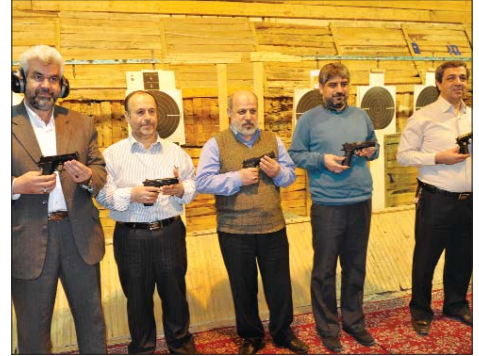
جمعی از مدیران صنعت نفت در گفت و گو با دانش نفت تاکید کردند: