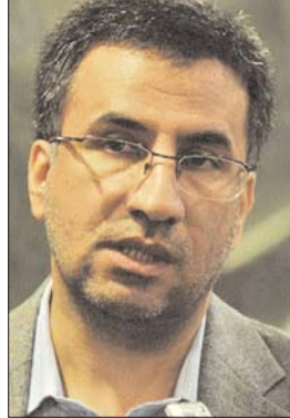
کشور صورت پذیرد. باید متولیان بخش آموزش و پژوهش کشور، ارتقای مطالعات حقوق و اقتصاد انرژی را در دانشگاه ها و مراکز علمی و پژوهشی کشور در دستور کار قرار دهند.

ادامه همکاری با کشورمان کناره گیری کرده اند. در حقیقت برداشت ما از این حرکت شرکت های خارجی یک نوع اعلام خصومت و اعلام برخورد رویارویی با ایران است. اگر بتوانیم در برابر این حرکت و اجماع ناعادلانه مقاومت کنیم و طرح های توسعه نفتی و گازی را خودمان به صورت مستقل اجرا کنیم، به شعار جهاد اقتصادی که رهبر معظم انقلاب بر آن تأکید کرده اند، جامه عمل پوشانده ایم. در این صورت افزون بر این که از منابع نفتی و گازی کشور به صورت بهینه بهره برداری کرده، به نفع تحریم ها و حساسیت هایی که شرکت های خارجی به آن روی آورده اند، مقابله کرده ایم. به طور طبیعی میدان گازی پارس جنوبی یک میدان مشترک است و هر کس که بتواند بیشتر بهره برداری کند، سود بیشتری نصیب می شود. هم اکنون کشور قطر در این میدان تقریباً سالانه ۲۵ میلیارد دلار از ایران بیشتر برداشت می کند. تعداد چاه های تولیدی و فازهایی که قطر در این میدان مشترک بهره برداری راه اندازی کرده، بیشتر از ایران است و ما در این زمینه کند عمل کرده ایم. تأکید رهبر معظم انقلاب این است که در زمینه برداشت از میدان مشترک گاز پارس جنوبی از رقیب خارجی خود عقب نمانیم و در واقع فعالیت خود را در زمینه توسعه میدان گازی پارس جنوبی با سرعت بیشتر و گام های محکم تر و جدی تر جلو ببریم.