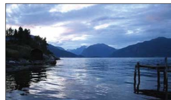
کوه های Sognefjord در نروژ