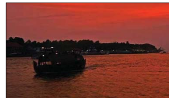
آباهای کرالا در جنوب هند