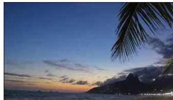
شهر ریوودژائیروی در فرانسه