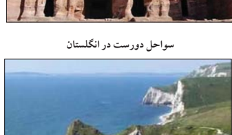
سواحل دورست در انگلستان