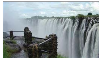
آبشار ویکتوریا در زامبیا