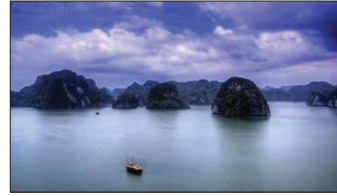
دریاچه Ha Long Bay در ویتنام