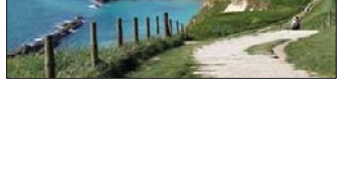
سواحل دورست در انگلستان