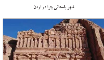
شهر باستانی پترا در اردن