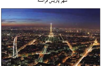
شهر پاریس فرانسه