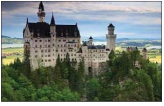
قصر Neuschwanstein در آلمان