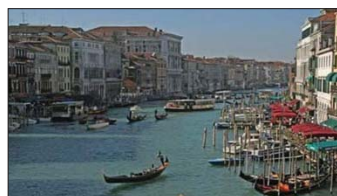
کانال قدیمی ونیز