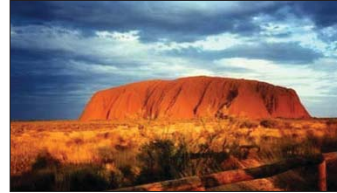
اولورو در استرالیا

مناظر طبیعی دیدنی جهان کم نیستند، اما این برای جذب بازدیدکننده کافی نیست؛ چرا که آثار باستانی و تاریخی نیز برای مردم دنیا جذاب است و همواره در فهرست پربازدیدکننده ترین جاهای جهان قرار دارد. نشنال جئوگرافی در فهرستی تازه نقاط پربازدید دنیا را معرفی کرده است. این مکان‌ها از آثار باستانی، سواحل، دریاها، ده‌های قدیمی هستند تا شهرهای مدرن: