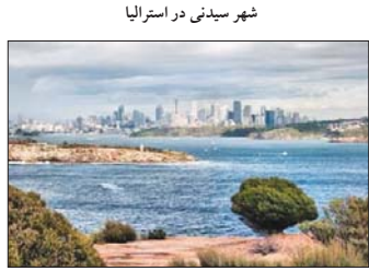
شهر سیدنی در استرالیا