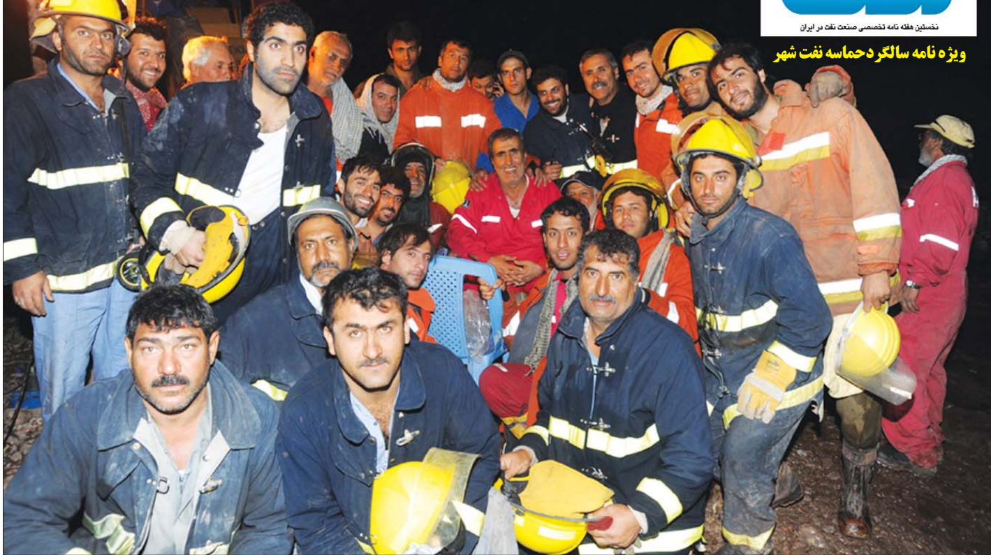
ویژه نامه سالگرد حماسه نفت شهر